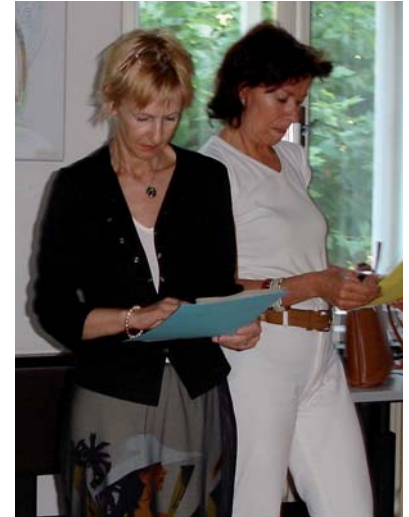
Teilnehmerinnen des Coachings beim «Lesen der Ernte»

Dabei ist eine Neuorientierung hin zu alternsgerechten, lebensphasenorientierten Arbeitsplätzen dringend angezeigt, die sowohl die Stärken, aber auch die Bedürfnisse in den verschiedenen Lebensabschnitten berücksichtigt. Die Entwicklung individueller Karrierepläne ist hier, vor allem für Frauen, von besonderer Wichtigkeit.