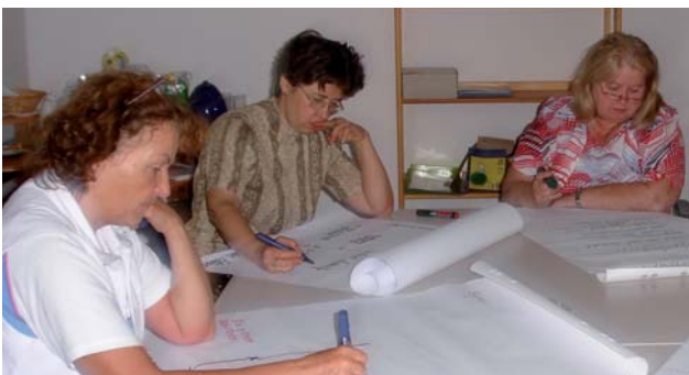
gemeinsame Erarbeitung individueller Profile

Darüber hinaus werden die schleichenden Veränderungen durch den demografischen Wandel in den Personalabteilungen noch kaum wahrgenommen.